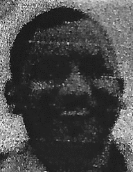
YOGI ADITYANATH HON'BLE CHIEF MINISTER, UTTAR PRADESH