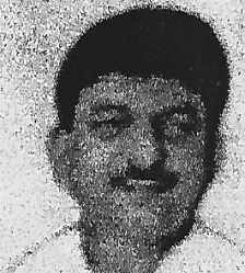
SHRI KAPIL DEV MISHRA HON'BLE MINISTER OF YOUTH, SKILL DEVELOPMENT, COURSE COORDINATION, EDUCATION & HEALTH DEVELOPMENT

HURRY!! LIMITED TIME OFFER REGISTRATION ONLY TILL 31.10.2020